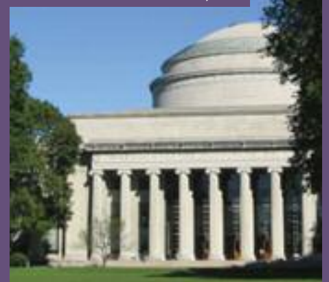
Canolfan Ddata Geo-ofodol, MIT