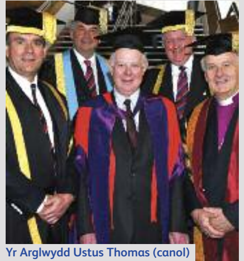
Yr Arglwydd Ustus Thomas (canol)

Wrth dderbyn ei radd er anrhydedd, dywedodd: “Ar ôl deugain mlynedd ym maes cyllid yn y DU, UDA, India a Malaysia, mae'n anrhydedd mawr i gael cydnabyddiaeth ar fy nhrothwy fy hun gan Brifysgol Cymru. Roedd yn bleser ac yn falchder enfawr i mi dderbyn y radd hon er Anrhydedd ochr yn ochr â chynifer o fyfyrwyr o wledydd lle'r wyf i wedi gweithio ac ymweld sawl tro. Rwy'n dymuno pob llwyddiant iddyn nhw wrth iddyn nhw ddechrau ar eu gyrfaedd eu hunain gyda'r hyder yr wyf i'n siŵr y bydd gradd Prifysgol Cymru yn ddi-os yn ei roi iddyn nhw.”