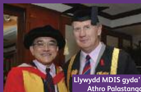
Llywydd MDIS gyda'r Athro Palastanga

myfyrywyr y bu'n eu harwain ac y bu'n poeni amdanynt trwy gydol eu hastudiaethau.