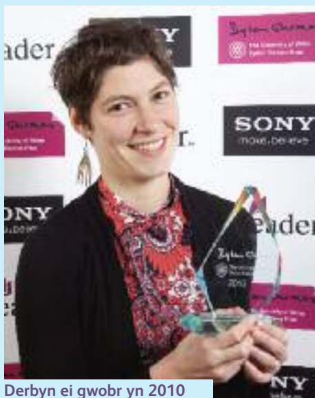
Derbyn ei gwobr yn 2010